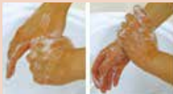
6. 反対の手で親指と手首をねじり洗い