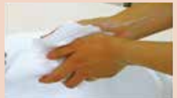
8. きれいな個人用ハンカチかペーパータオルで水分をふき取る