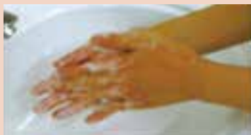
2. 石鹸をとり、手のひらで泡立てる