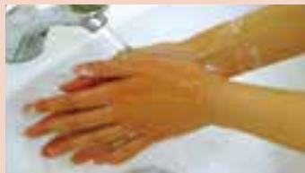
7. 流水でよく洗い流す