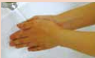
1. 時計をはずし、手をぬらす