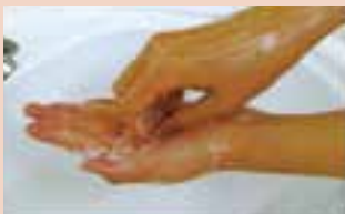
5. 反対の手のひらで指先を洗う