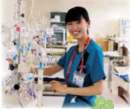
臨床工学技士(透析センター)