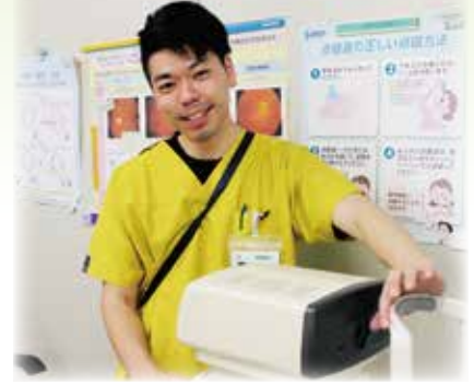
視能訓練士(眼科外来)