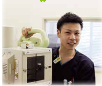
診療放射線技師(放射線科)