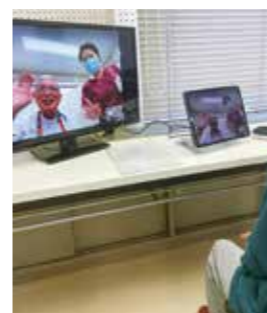
粟生町公民館での様子